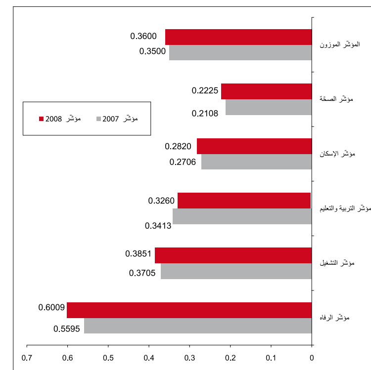
الرسم 6.2: قيم المؤشرات التجميعية في الصحة، والإسكان، والتعليم، والتشغيل، والرفاه الاجتماعي، ومؤشرات المساواة الموزونة 2007-2008

يظهر في الرسم 6.2 قيمة المؤشر الموزون وقيمة المؤشرات التجميعية الخمس في العام 2007 وفي العام 2008.