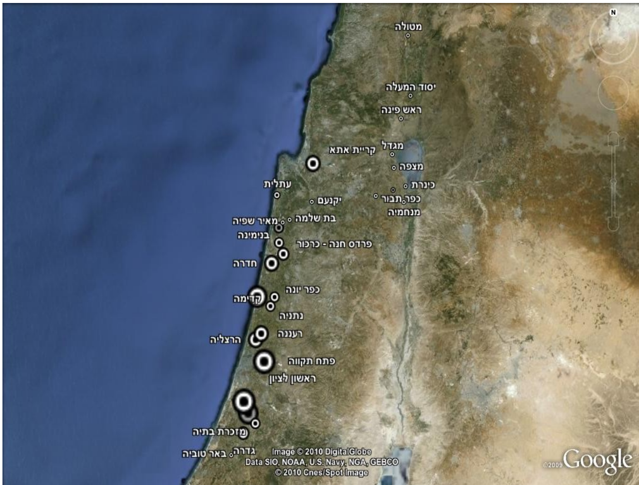
המושבות המעויירות והמושבות הכפריות שנת 2010.

אפשר להסתכל על המושבות העבריות ולראות את "תהליך ההתבגרות העירוני" שעבר על החברה היהודית בישראל. לצד זה, כיום, החברה הערבית בישראל עומדת על סף תהליך התבגרות דומה. הכלים שיש ברשות הממסד וברשות הנהגת היישובים הערביים והאזרח הערבי יקבעו, בעזרת מערכת היחסים ביניהם, אם עתיד היישובים הערביים יתפתח לכיוון אליו התפתחו המושבות העבריות או לכיוון אחר. מה ניתן לומר בוודאות הוא שהחברה הערבית זקוקה לפתרון תכנוני ומרחבי ממשי לפיתוח.