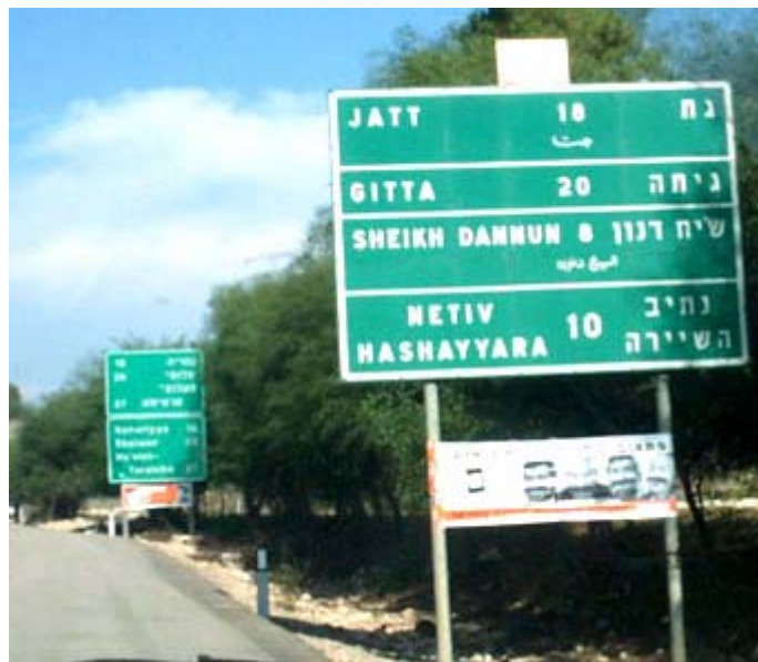
תמונה 1: מצומת ג'דידה לכיוון כפר יאסיף