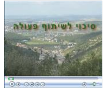
סרט וידאו (11 דקות) אודות פרויקט שיתוף הפעולה המוניציפלי

תאור המודל למתווה לשיתוף פעולה יהודי-ערבי בין רשויות מוניציפאליות מתואר כאן . והנה קישור לסרטון המתאר את פעולת פרויקט הפיילוט בוואדי עארה.