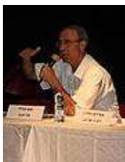
חח"כ ד"ר חנא סוויד, חבר ועדת חוקה